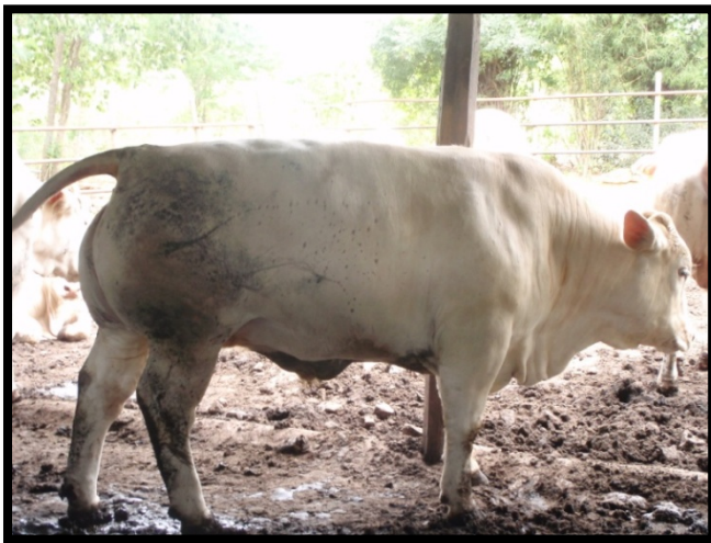
โคของสุมิตรฟาร์ม (เมธิ)